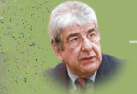
Rafael Espada vicepresidente

De los 40 miembros que viajaron a la Cumbre Mundial del Cambio Climático, 6 fueron patrocinadas por el Ministerio de Ambiente, con fondos de un préstamo destinado a la protección de la Reserva de la Biosfera Maya. A criterio de ambientalistas, el gasto que hizo el Gobierno fue excesivo para los escasos resultados obtenidos.