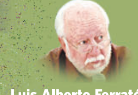
Luis Alberto Ferraté ministro de Ambiente