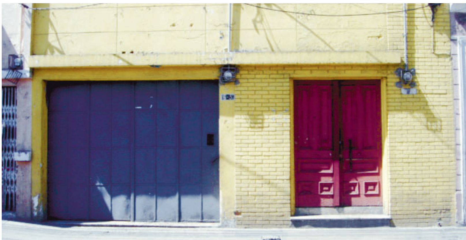
FACHADA DEL INMUEBLE de Pro Ciegos apropiado indebidamente ubicado en el Centro Histórico.

Firma indubitada es de trazo inclinado en formación de una "J" y una "M" mayúscula del apellido Meany.